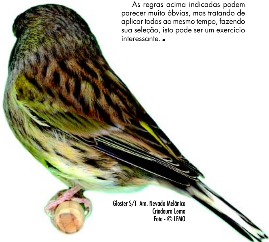
Gloster S/T Am. Nevado Melânico Criadouro Lemo

As regras acima indicadas podem parecer muito óbvias, mas tratando de aplicar todas ao mesmo tempo, fazendo sua seleção, isto pode ser um exercício interessante. ●