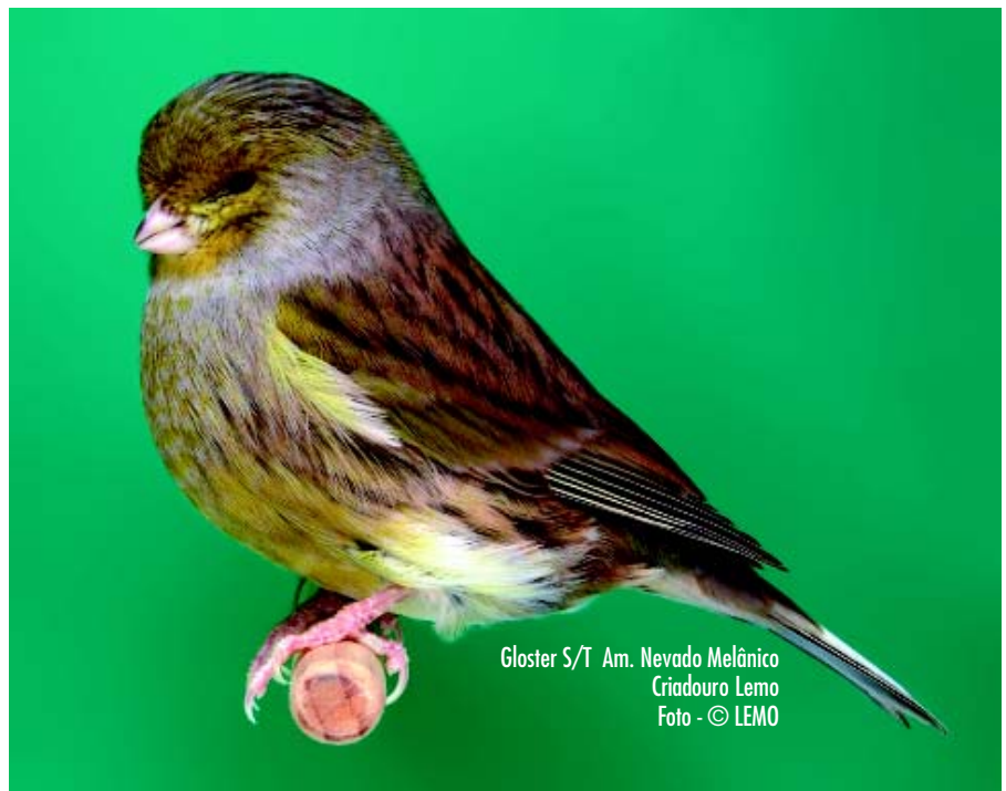
Gloster S/T Am. Nevada Melânico Criadouro Lemo

4.1. O Corona é provavelmente o canário de tipo mais difícil de produzir e a maioria das pessoas não têm muitos pássaros de qualidade superior para