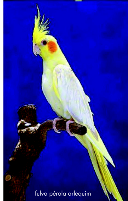
fulvo pérola arlequim