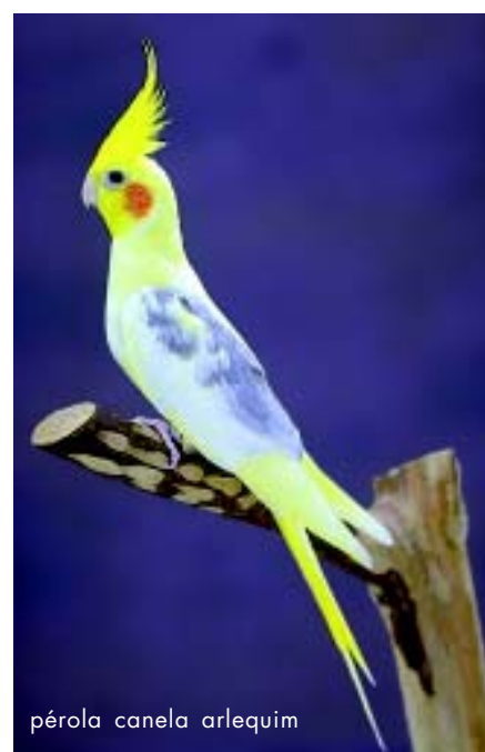
pérola canela arlequim