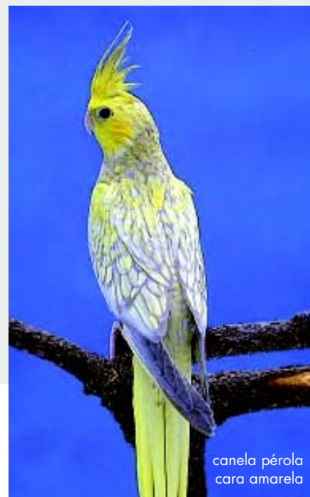
canela pérola cara amarela

Cara Amarela Dominante - Semelhante ao recessivo, mas apenas um pouco mais forte no amarelo. Aves duplo fator podem ser discretamente alaranjadas, mesmo assim muito mais fracas que as aves PASTEL. Aves de fator simples são totalmente amarelas na face. •