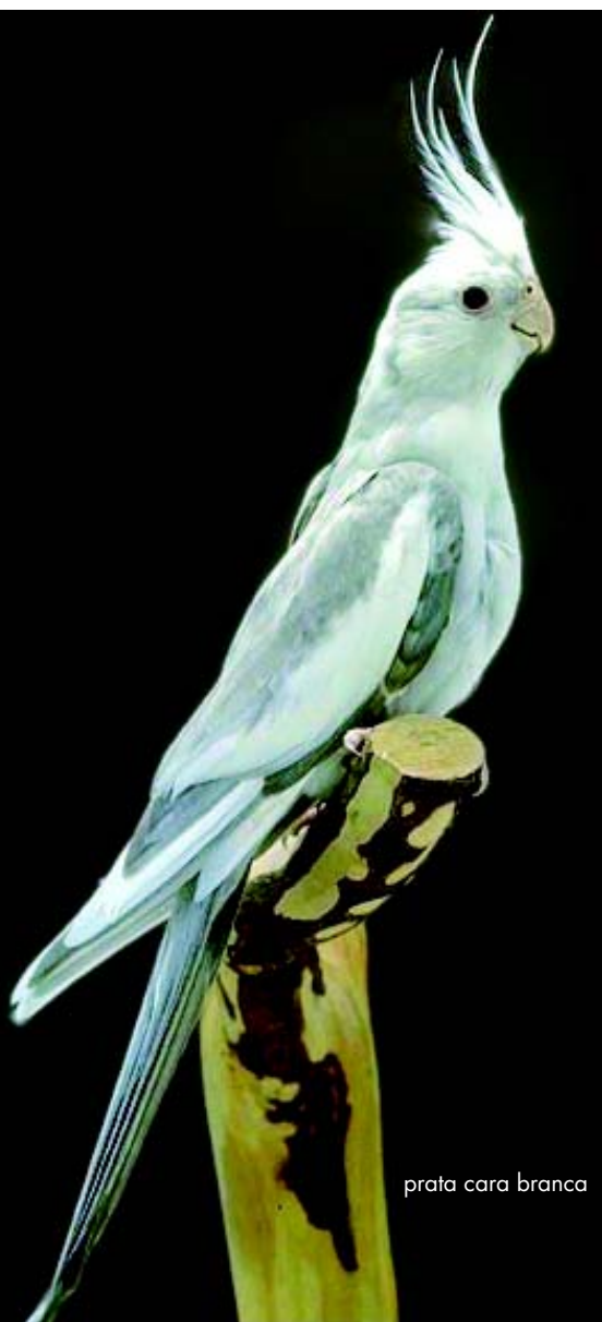
prata cara branca

Ino - são as lutinas, aves brancas com ausência total de eumelaninas, mas que preservam a psitacina, assim possui face